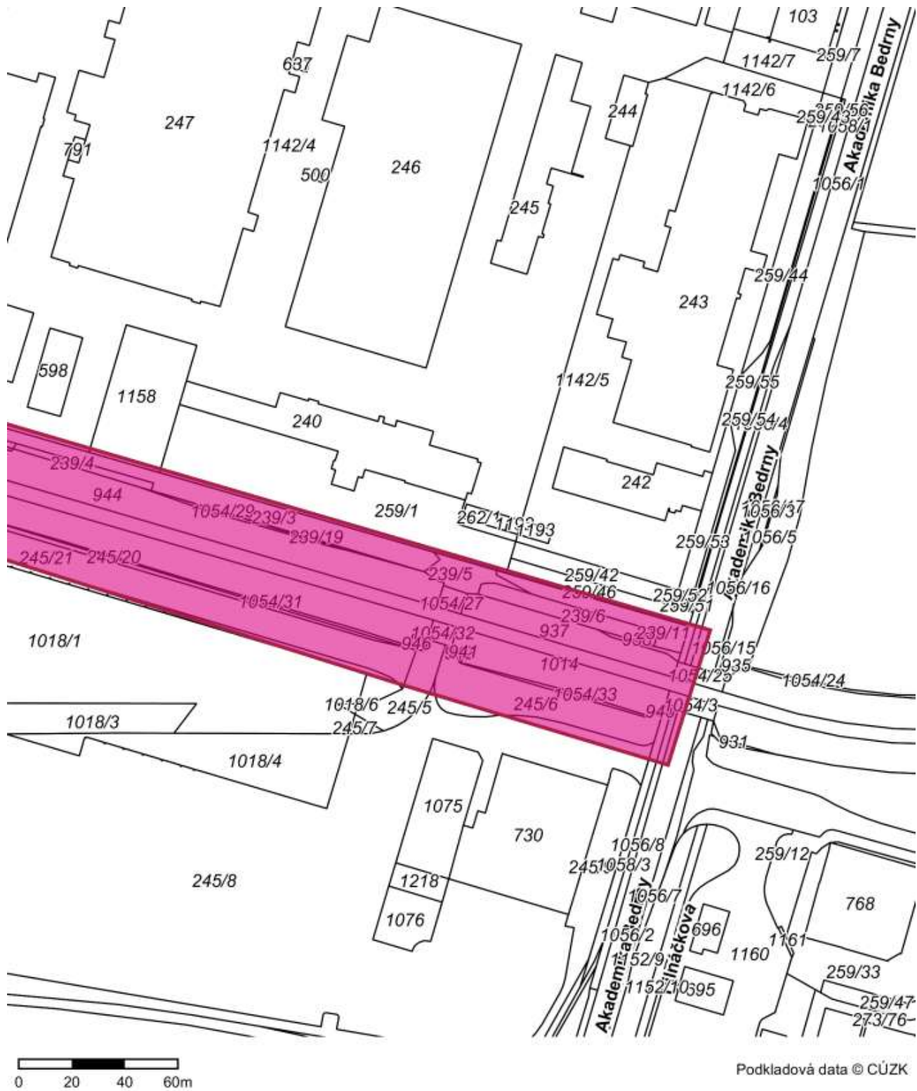
Polygon 1 - Detail - list atlasu 2/2

Popis polygonu: k.ú. Věkoše p.č. 1054/1, 944, 1013, 937, 1014, koryto Pilietického potoka